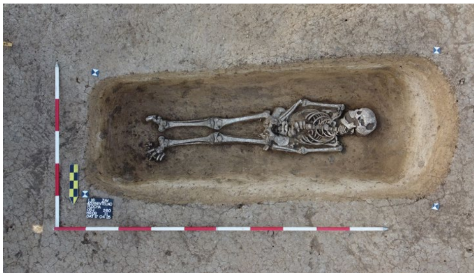
OBR. 3. Jizerní Vtelnlo (okr. Mladá Boleslav). Obj. 260 / H 11.

První exemplář denáru typu Cach (1972) č. 350 se podařilo odkrýt v nenarušeném objektu 260 (hrob 11), který se nacházel na jižním okraji prostřední řady hlavní části pohřebiště (obr. 3). Uložen byl nad pravou částí pánevní kosti v blízkosti páteře. Dobře zachovaný skelet byl uložen v poloze na zádech s orientací východ – západ s hlavou orientovanou na západ a obličejem otočeným k jihu.