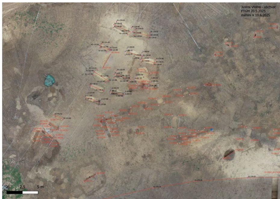
OBR. 2. Jizerní Vtelně (okr. Mladá Boleslav). Plán kostrového raně středověkého pohřebiště.

Nejmladší komponentou lokality bylo ploché kostrové pohřebiště v západní části úseku II, čítající 17 hrobů s orientací zhruba východ – západ s hlavami uloženými k západu (obr. 2). K němu přiléhají stopy po 18 m dlouhé srubové stavbě s vchodem orientovaným směrem k pohřebišti, která je však bez nemovitých archeologických nálezů, což znemožňuje s jistotou určit její souvztažnost k funerálnímu areálu. Třináct hrobů bylo uspořádáno do tří řad v počtu 5-4-4, zbylé čtyři hroby byly vyděleny na jihozápadním okraji pohřebiště.