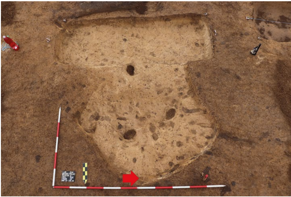
OBR. 4. Jizerní Vtelno (okr. Mladá Boleslav). Obj. 302 / H 14 (červená šipka označuje místo nálezu denáru).

Nález dvojice denárů Vratislava II. typu Cach (1972) č. 350 na raně středověkém pohřebišti v Jizerním Vtelně pouze dokresluje zvyk vkládání mincí, tzv. „obolu mrtvých“, do hrobů v rámci pohřebních obřadů v průběhu 10.–12. století v Čechách. Podle soupisů a statistik, publikovaných v letech 1956–2013, vrcholilo vkládání mincí do hrobů právě v polovině 11. století, v období vlády Vratislava II. ( Radoměský 1955, 43; Klápště 1999, 786; Marethová 2008, 11; Bartošková 2013, 130). Ačkoli byl tento rituál znám již od antiky, setkáváme se s ním v Čechách až od 2. poloviny 10. století v souvislosti s rostoucím používáním mince v rámci společenských a hospodářských proměn přemyslovského státu. Zatímco na nekostelních řadových pohřebištích, jakým je i případ Jizerního Vtelna, zvyk vkládání „obolu mrtvých“ ustává na počátku 12. století, na etážových kostelních hřbitovech přetrvává, byť ve zmenšené míře, až do raného novověku.