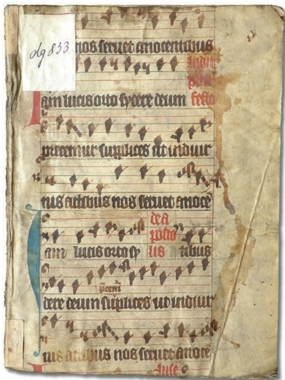
Obr. 2: Fragment breviáře nebo hymnáře ze 2. poloviny 14. století. Německá gotická notace. Přední strana vazby. KNM – Nostická knihovna, sign. dg 833 (č. katalogu 29).