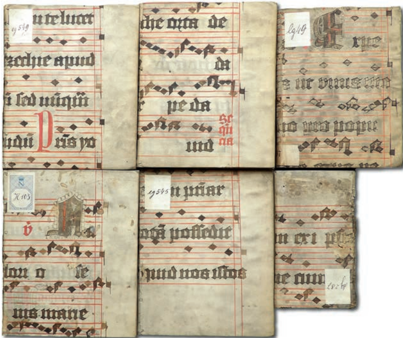
Obr. 4: Šest vazeb s částmi z graduálu z 15. století, notace métsko-gotická. Přední strany vazeb. KNM – Nostická knihovna, sign. dg 287, eg 545, eg 549/1,2, H 103 a lg 49 (čísla katalogu 2, 38, 39, 40, 59 a 65).

Nejpestřejší obraz poskytují zlomky s métsko-gotickou notací, kterých (včetně smíšených typů) bylo v Nostické knihovně dosud evidováno třicet šest. Také mezi nimi se podařilo určit několik skupin knih s vazbami z téhož zdroje pergamenu. Na prvním místě jsou to již zmíněné zangiovské tisky spolu s dalšími dvěma vazbami (2, 38, 39, 40, 59, 65): celek tedy představuje šest folií z graduálu ze 2. poloviny 15. století, jež obsahují sekvenci Stirpe Maria regia (Narození Panny Marie) a verš Nativitas gloriose virginis Mariae k témuž svátku, mariánské Alleluia a antifonu na Květnou neděli Unus autem ex ipsis Caiphaz . Podle hudebně-paleografické systematiky Janky Szendrei se jedná o notaci slezského typu s neumami manýristicky zakončenými punctem nebo ostře seříznutými širokými dříky (Obr. 4). Čtyři