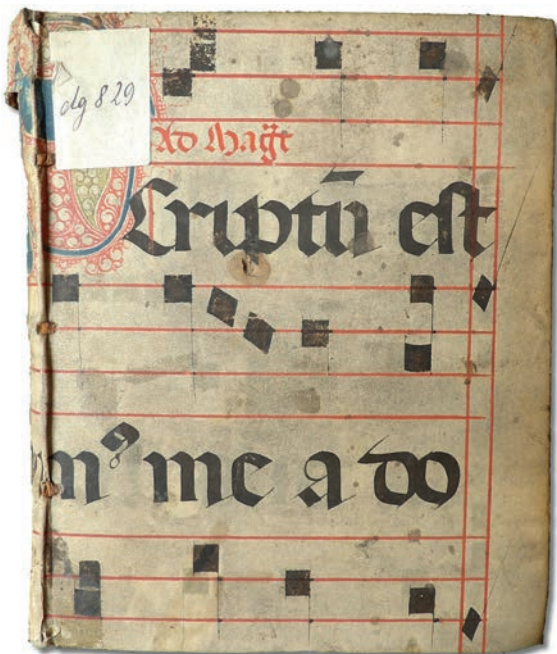
Obr. 3: Fragment antifonáře nebo breviáře z 15. století s kvadratickou notací. Přední strana vazby. KNM – Nostická knihovna, sign. dg 829 (č. katalogu 28).