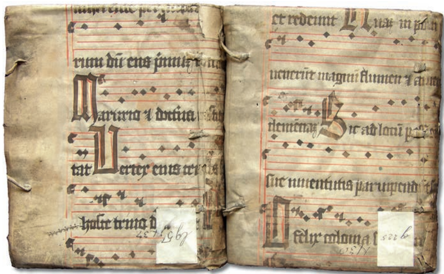
Obr. 5: Dva fragmenty sekvenciáře z 15. století s métsko-gotickou notací. Přední strany vazeb. KNM – Nostická knihovna, sign. eg 225 a lg 50 (čísla katalogu 32 a 66).

vazby (15, 17, 22, 30) jsou pokryty pergamenem ze sekvenciáře z přelomu 14. a 15. století, v němž vzhledem k sylabičnosti zpěvu nefigurují složitější neумы – přesto však evidujeme tvary typické pro prameny z Vratislavi ( pes tvořený dvěma puncty obrácenými doleva a po hraně spojenými tenkou čárkou), climacus a scandicus tvořené puncty v těsné řadě za sebou, clivis je métská. 13 Totéž platí o dvou vazbách (42, 62) obsahujících hymny a sekvence k Narození Páně, sv. Janu Evangelistovi a sv. Štěpánu a částečně o dvojici (32, 66) ze sekvenciáře z 15. století se sekvencemi Virginalis turma sexus a Laeto corde resonemus ke sv. Voršile a sv. Barboře (Obr. 5). Dvě vazby (4, 61) notované zběžným kurzívním métsko-gotickým písmem přísluší k breviáři z 15. století, v obou případech se zpěvy vztahují ke Květné neděli.